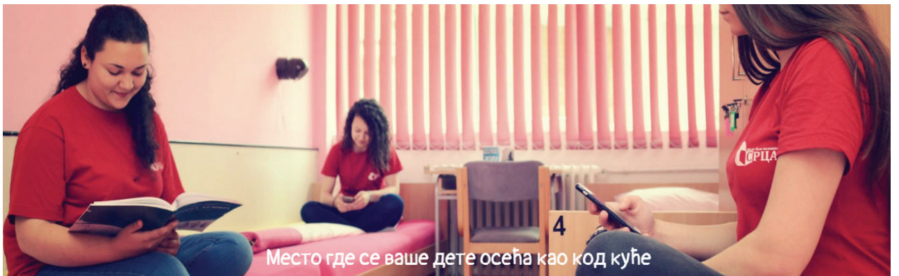
Место где се ваше дете осећа као код куће